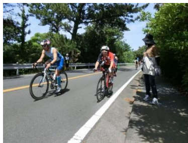
バイク:三段壁 付近