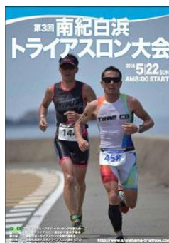
大会パンフレットへの広告掲載